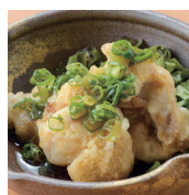
ユーリンチー 350円 (税別)