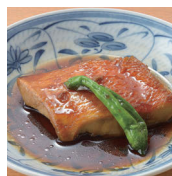
金目鯛煮付 400円 (税別)