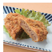
あしたか牛のコロッケ 300円 (税別)

新鮮な伊豆ならではのわさびやお茶等、名産品をご提供。遠くの方へのお土産、また夕飯のおかずにご利用いただける幅広い品揃えを心がけております。 新鮮な食材をご用意致しますので、ご到着時間をお知らせください。各メニューはご予算に応じて承ります。詳しくはお問い合わせください。 ※季節によりお料理の内容が変わることがございます。