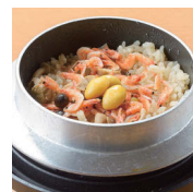
桜えび釜飯 500円 (税別)