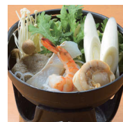
海鮮小鍋 500円 (税別)